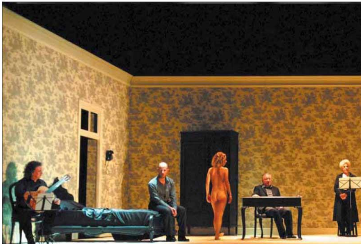
Una escena de Coral romput al Teatre Lliure.