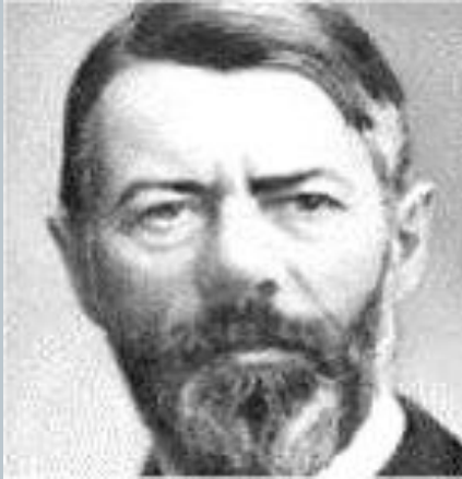
Max Weber (1864 – 1920)