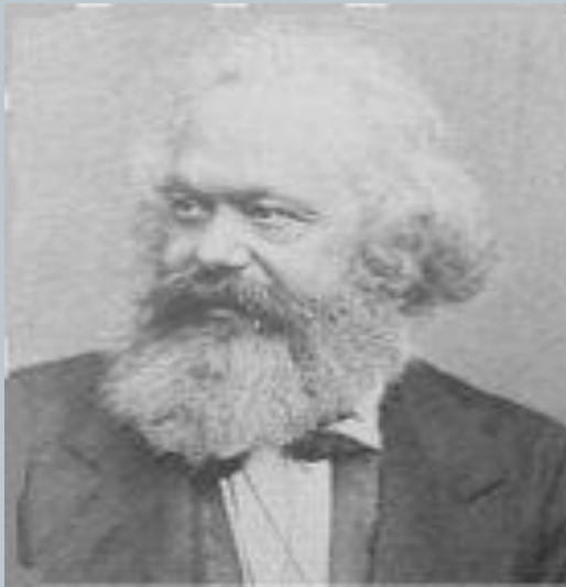
K. Marx (1818 – 1883)