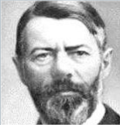
Max Weber (1864 – 1920)